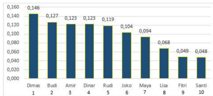
Gambar 3. Grafik Perangkingan Penerima Bantuan UKT/SPP