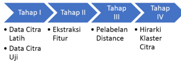
Gambar 1 Tahapan Penelitian

Pada penelitian ini terdapat 4 7 tahapan penelitian seperti terlihat pada Gambar 1.