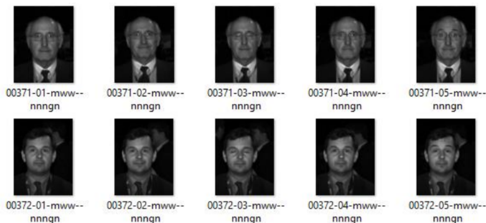
Gambar 2 Contoh Data Citra Wajah Frontal