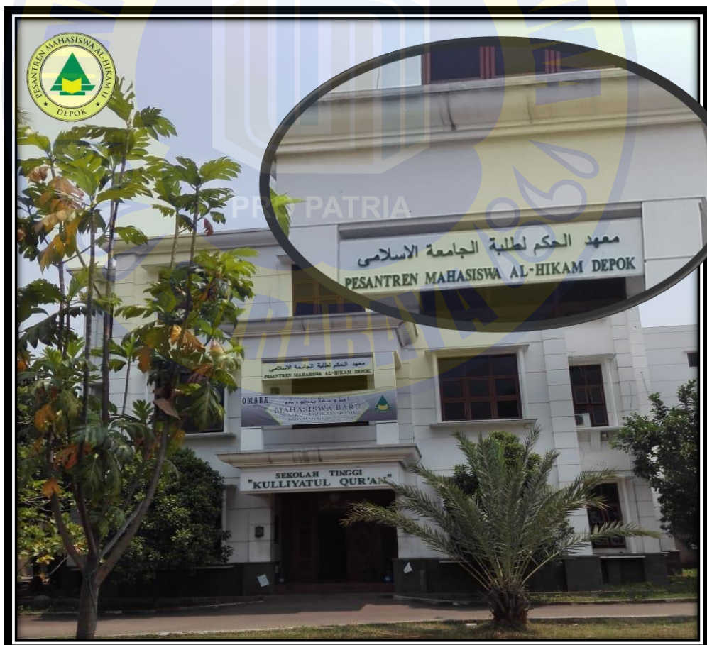
Gedung Pesantren Mahasiswa Al-Hikam Depok