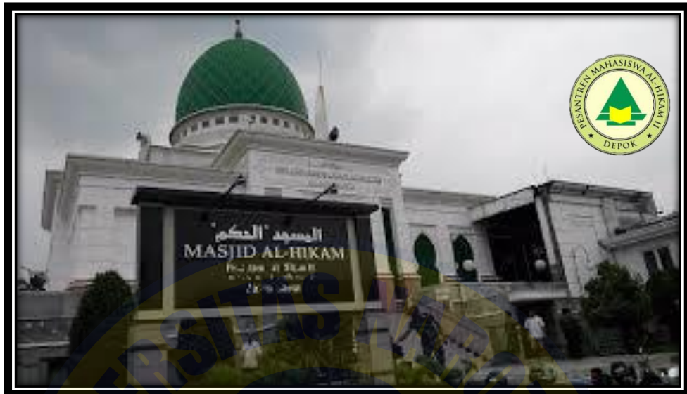
Masjid Al-Hikam, Pesantren Mahasiswa Al-Hikam Depok