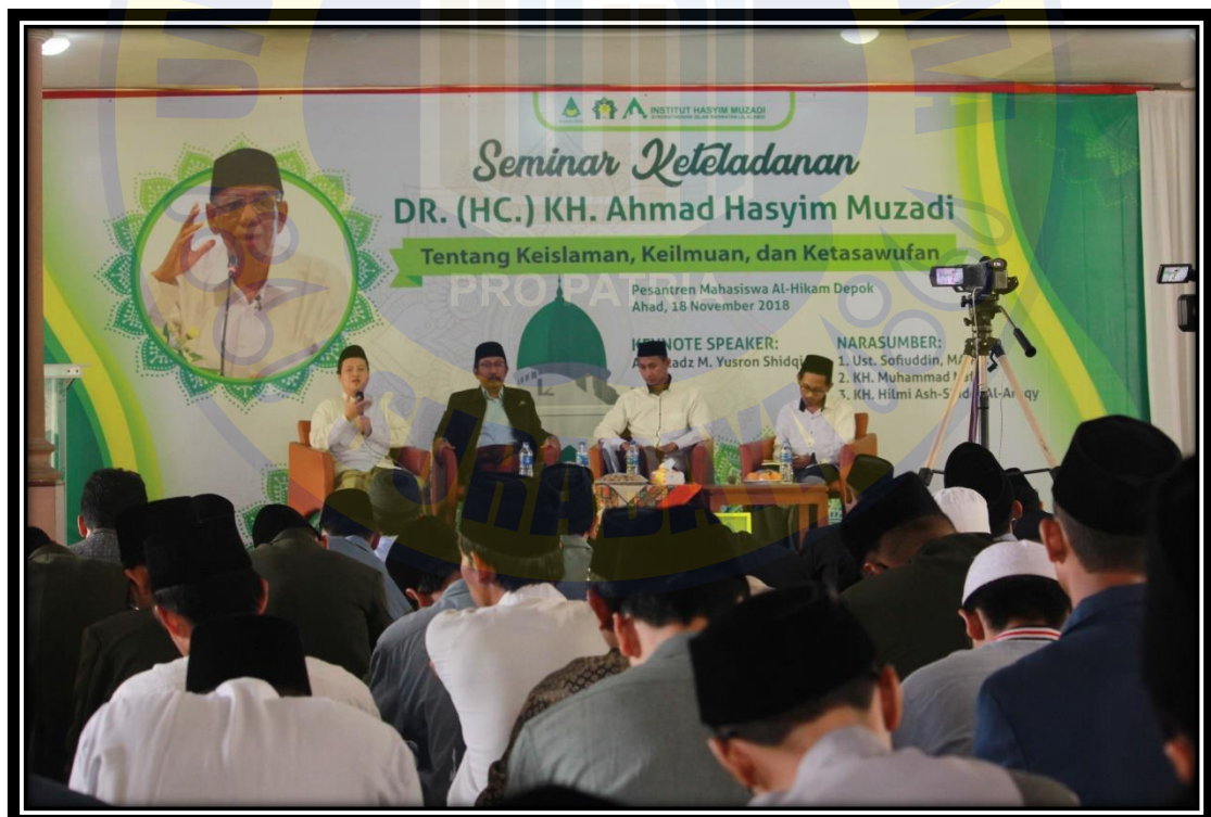
Seminar Keteladanan Pendiri Pesantren Mahasiswa Al-Hikam Depok (2019)