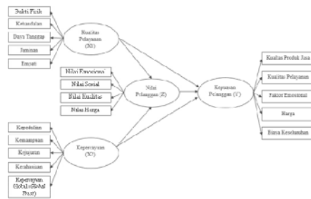
Gambar 1. Model berbasis Teori

Model teori diatas dibangun atas dasar Kajian Literatur. Dimana terdiri dari dua jenis variabel, yaitu variabel eksogen dan endogen. Kualitas Pelayanan ( Service Quality ) dan Kepercayaan Pelanggan ( Customer Trust ) merupakan variabel eksogen, Nilai Pelanggan ( Customer Value ) dan Kepuasan Pelanggan ( Customer Satisfaction ) merupakan variabel endogen.