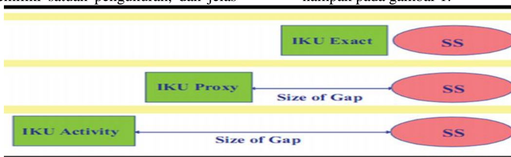
Gambar 1. Tingkat validitas IKU

1. Tingkat validitas IKU. Validitas suatu IKU ditentukan berdasarkan tingkat kedekatan IKU tersebut dengan tujuannya (SS) sebagaimana nampak pada gambar 1.