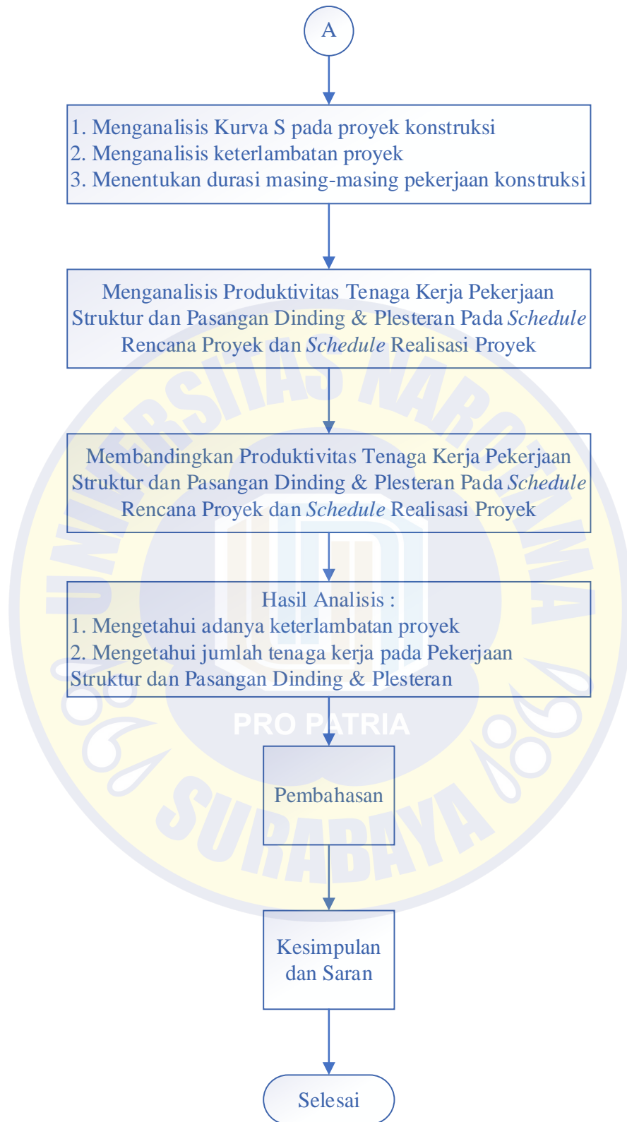
Gambar 3.1 Diagram Alir Penelitian