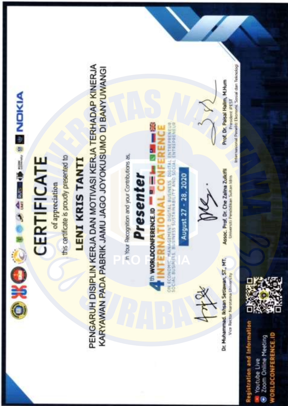
Lampiran 2. Sertifikat Conferent