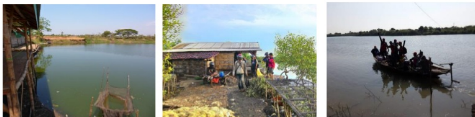
Gambar 2. Petambak Ikan Desa Kedungpandan Jabon kabupaten Sidoarjo serta Teknologi Produksi Pakan Ikan Solarcell