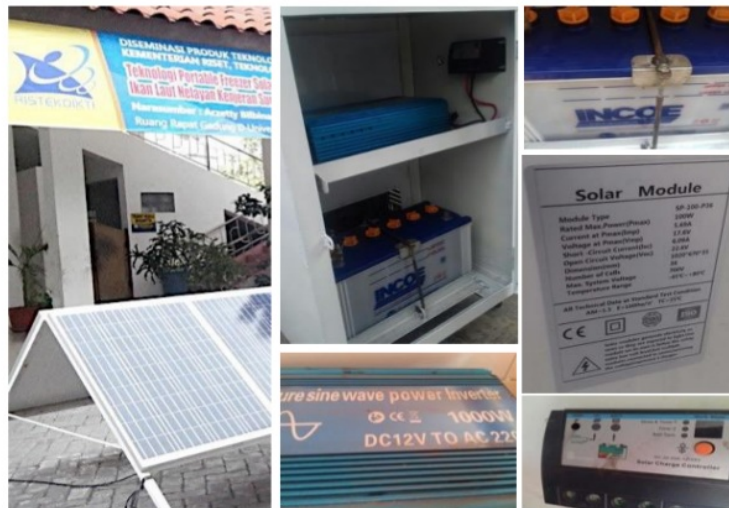
Gambar 3. Teknologi Solarcells produk LPPM Universitas Narotama