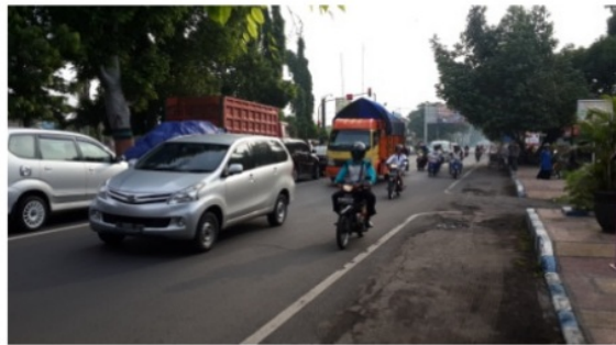
Gambar 3 Jl. Panglima Sudirman – Jl. Soekarno Hatta Kota Probolinggo