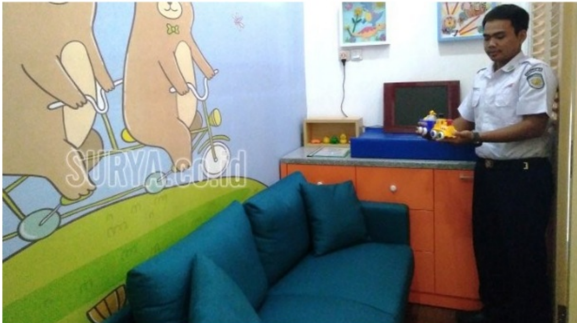
Gambar 4.5 Ruang Laktasi & Pos Kesehatan