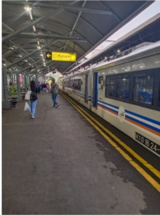
Gambar 4.4 Fasilitas Naik/Turun Penumpang