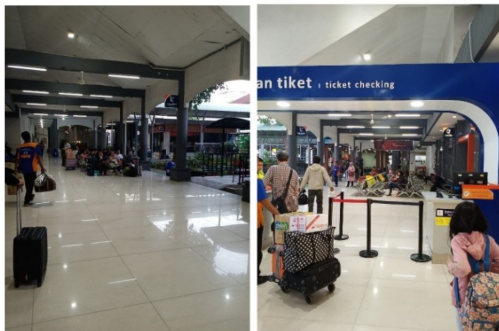
Gambar 4.3 Fasilitas Ruang Tunggu