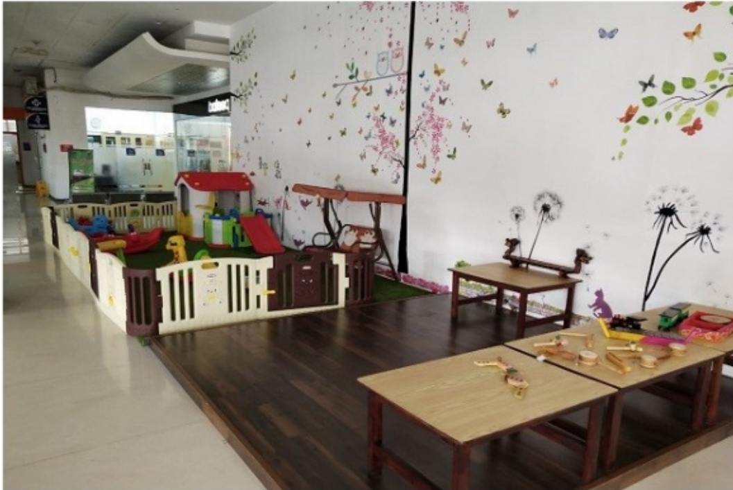
Gambar 4.6 Ruang bermain untuk menunggu kedatangan penumpang