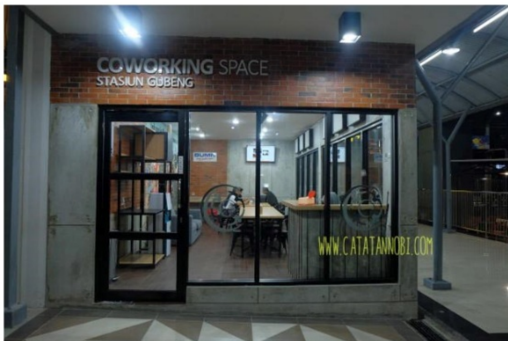
Gambar 4.7 Coworking Space