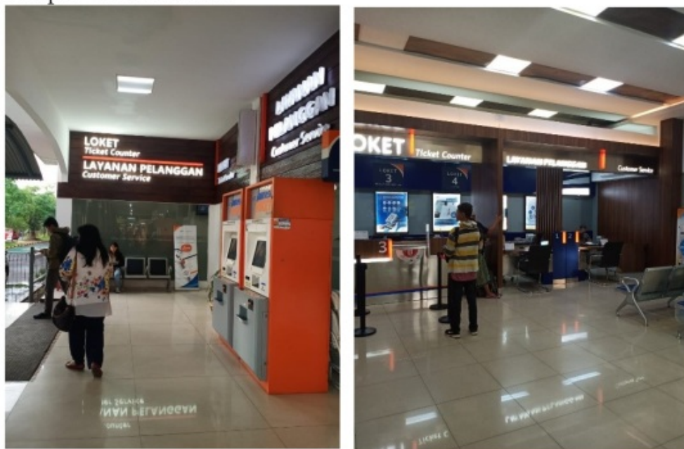
Gambar 4.1 Fasilitas Loker Pembelian Tiket

Jika dilihat dari tabel 4.1 di atas, untuk masing-masing fasilitas dapat diketahui tingkat kepuasannya, untuk tingkat kepuasan tertinggi adalah fasilitas pembelian tiket/loket. Fasilitas pembelian tiket mendapatkan tingkat kepuasan tertinggi di karenakan pengguna kereta api dapat di layani secara offline atau pembelian langsung di loket yang sudah tersedia di stasiun atau dengan membeli secara online melalui internet yang bisa di akses kapan pun dan dimana pun melalui website resmi kereta api Indonesia dan untuk mencetak tiket juga disediakan fasilitas printout tiket di stasiun Gubeng. Sedangkan fasilitas dengan tingkat kepuasan terendah adalah fasilitas kesehatan yang ada di stasiun Gubeng, hal ini disebabkan karena tidak belum lengkapnya fasilitas klinik bagi pengguna kereta api, pemeriksaan hanya bersifat umum. Ruang laktasi terlihat sangat nyaman, berada satu lokasi dengan pos kesehatan. Lebih jelasnya mengenai fasilitas yang sudah tersedia di stasiun Gubeng dapat dilihat dari foto yang ada pada Gambar 4.1 sampai Gambar 4. 8.