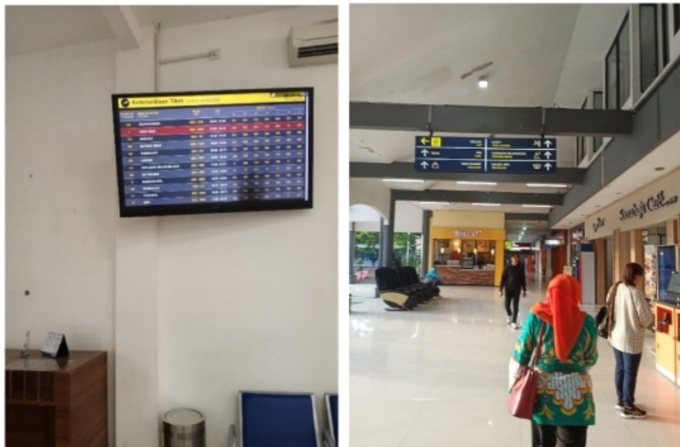
Gambar 4.2 fasilitas Informasi dan Petunjuk Arah