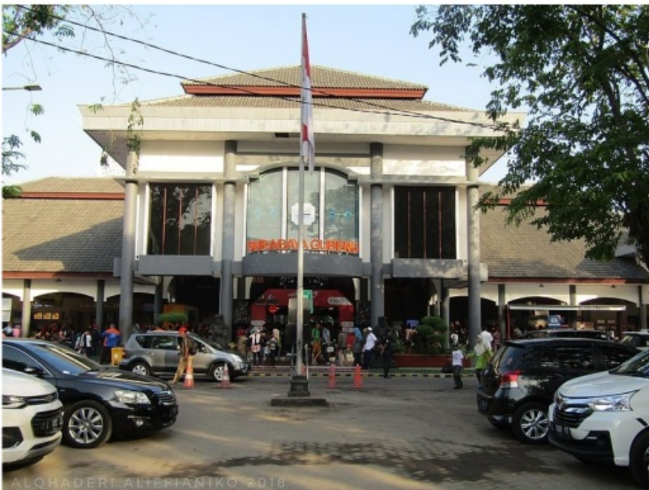
Gambar 4.8 Fasilitas Parkir Kendaraan Roda 2 dan Roda 4

Sedangkan untuk mengetahui prioritas peningkatan mutu pelayanan, fasilitas yang sudah ada saat ini, variabel/fasilitas diplotkan kedalam kuadran Importance Performance Analysis berdasarkan nilai rata-rata tingkat kepuasan dan nilai rata-rata prioritas peningkatan fasilitas. Untuk lebih jelasnya mengenai pembagian kuadran Importance Performance analysis dapat dilihat pada Gambar 4.7 berikut.