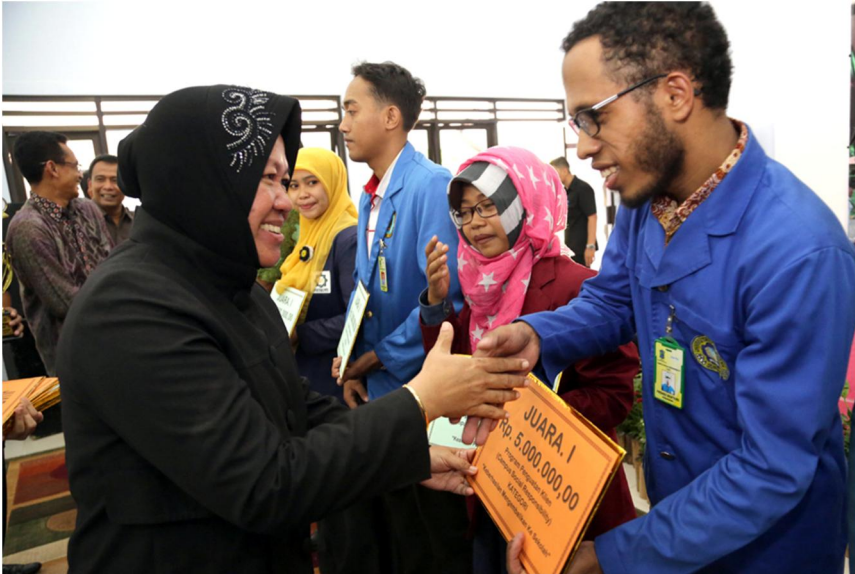
SOSIALISASI SKIM HIBAH SIMLITABMAS 5 NOVEMBER 2014