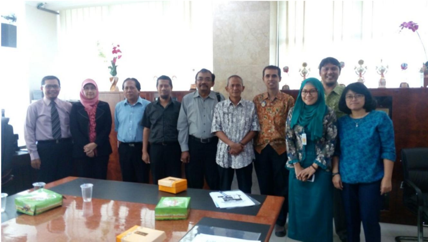
BIMBINGAN TEKNIK PENYEDIA JASA KONSTRUKSI DAN JASA KONSULTANSI KABUPATEN PROBOLINGGO, 14 DESEMBER 2015