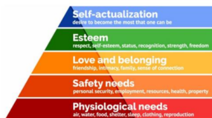
Gambar 1. Maslow`s Hierarchy of Needs Explained (Hopper, 2020)

Berdasarkan Maslow`s hierarchy needs explained didapatkan informasi bahwa kebutuhan seseorang memiliki tingkatan/ hierarchy . Ilustrasi dari maslow`s hierarchy of needs explained dapat dijelaskan sebagai berikut :