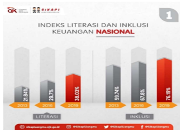
Gambar 1.1 Grafik Literasi Keuangan dan Inklusi Periode 2013-2019

Otoritas Jasa Keuangan (OJK) memiliki komitmen tinggi dalam mendorong peningkatan indeks literasi dan inklusi keuangan nasional melalui pengembangan ekosistem jasa keuangan seperti; 1) memanfaatkan teknologi digital dalam peningkatan indeks literasi keuangan; 2) membangun dan meningkatkan aliansi strategis dalam pelaksanaan program literasi dan edukasi keuangan; dan 3) memperluas akses dan ketersediaan produk dan layanan jasa keuangan yang inklusif.