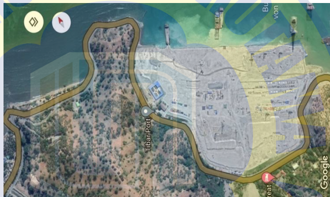
Gambar 3. 2 Peta Lokasi Tibar Bay Port International Timor-Leste

Lokasi penelitian ini dilakukan di pelabuhan internasional yang berada di Tibar, Liquica Timor-Leste.