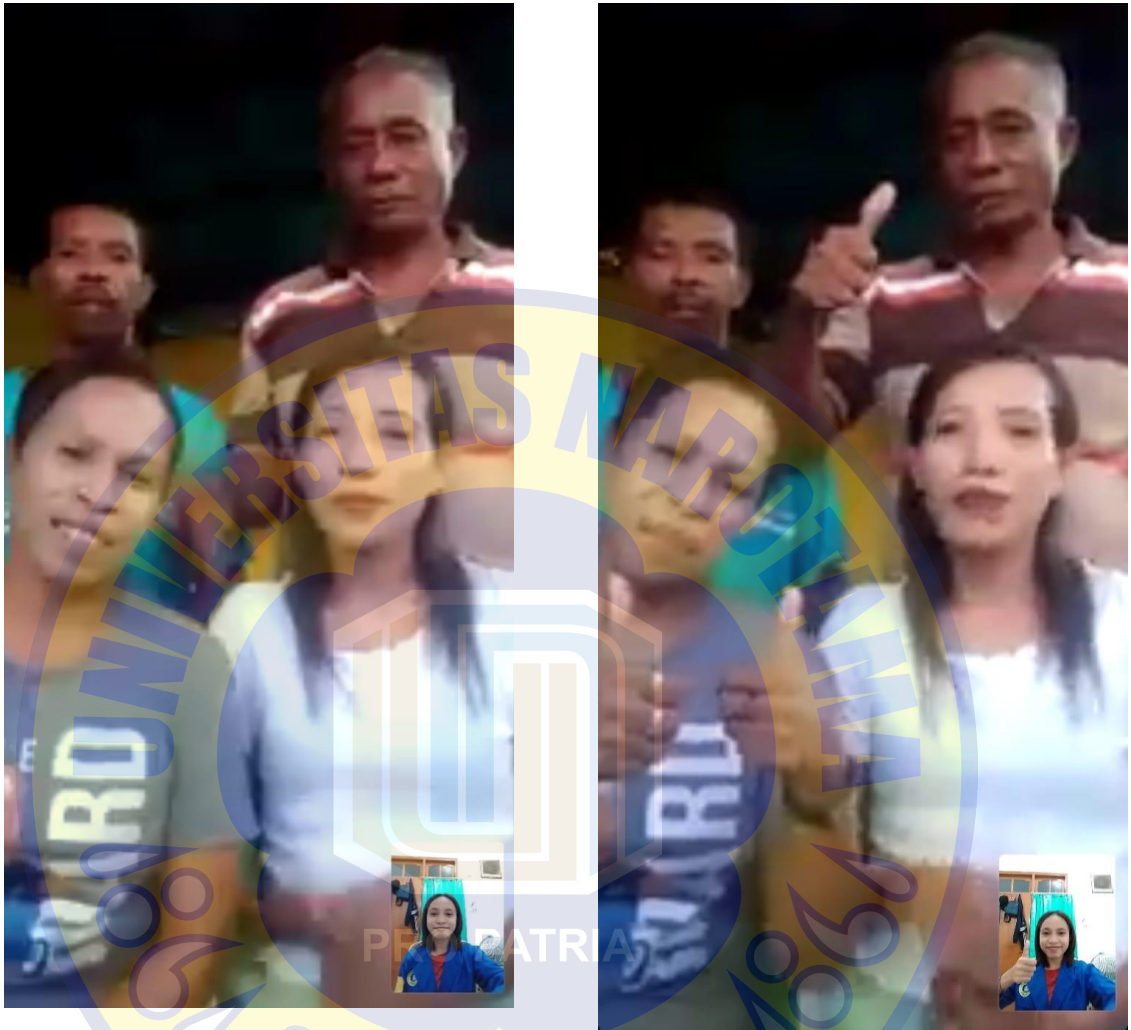
Gambar 8 Dokumentansi Wawancara