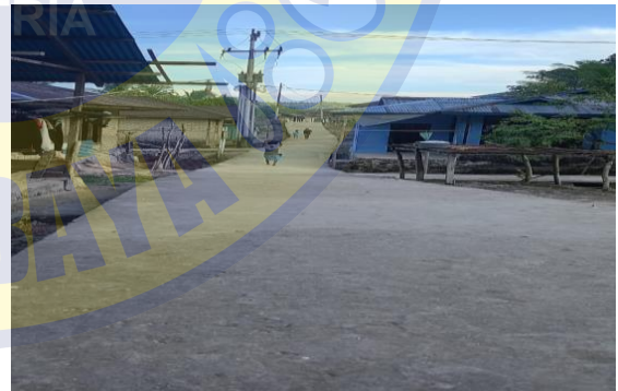
Gambar 7 Realisasi Pembangunan (Jalan, Bantuan Rumah, Gapura Desa)