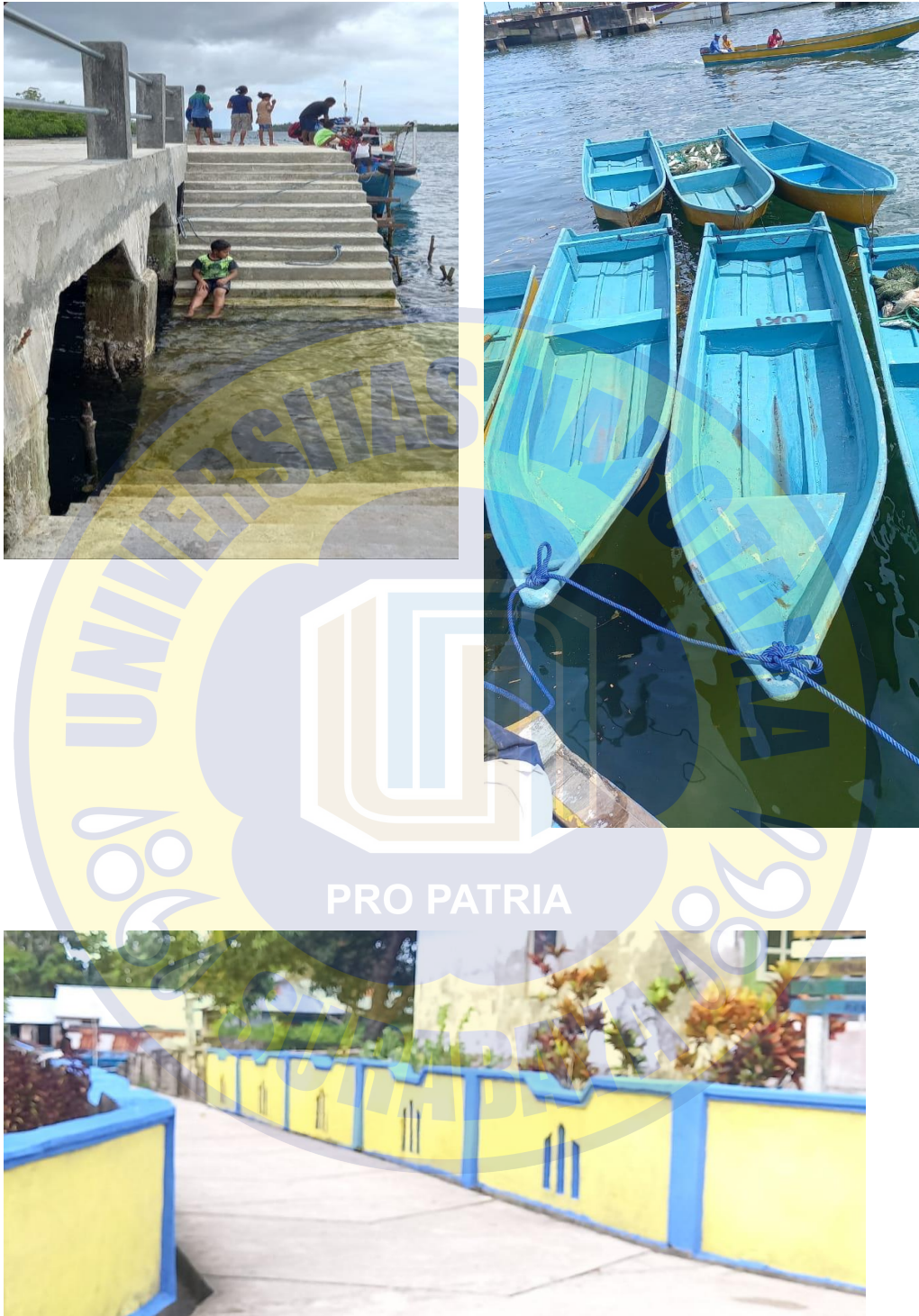
Gambar 6 Realisasi Pembangunan (Pagar desa dan bantuan speatboat)