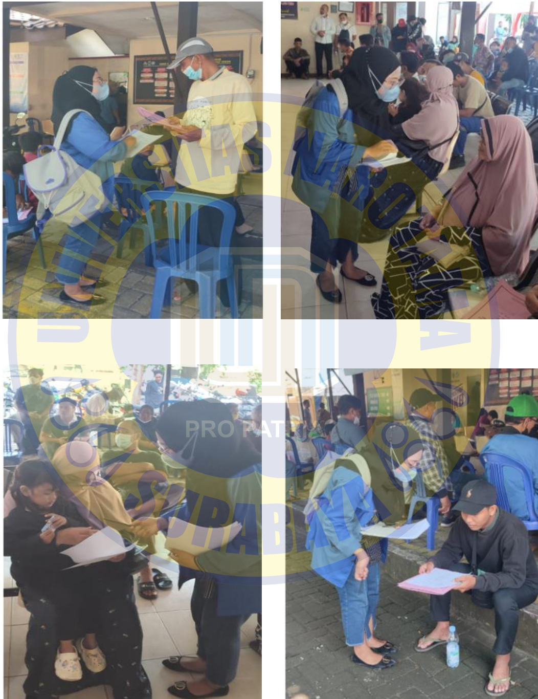
Dokumentasi ketika wajib pajak mengisi kuesioner penelitian