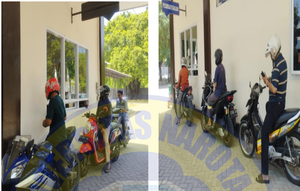
Dokumentasi pembayaran pajak dengan Samsat Drive Thru