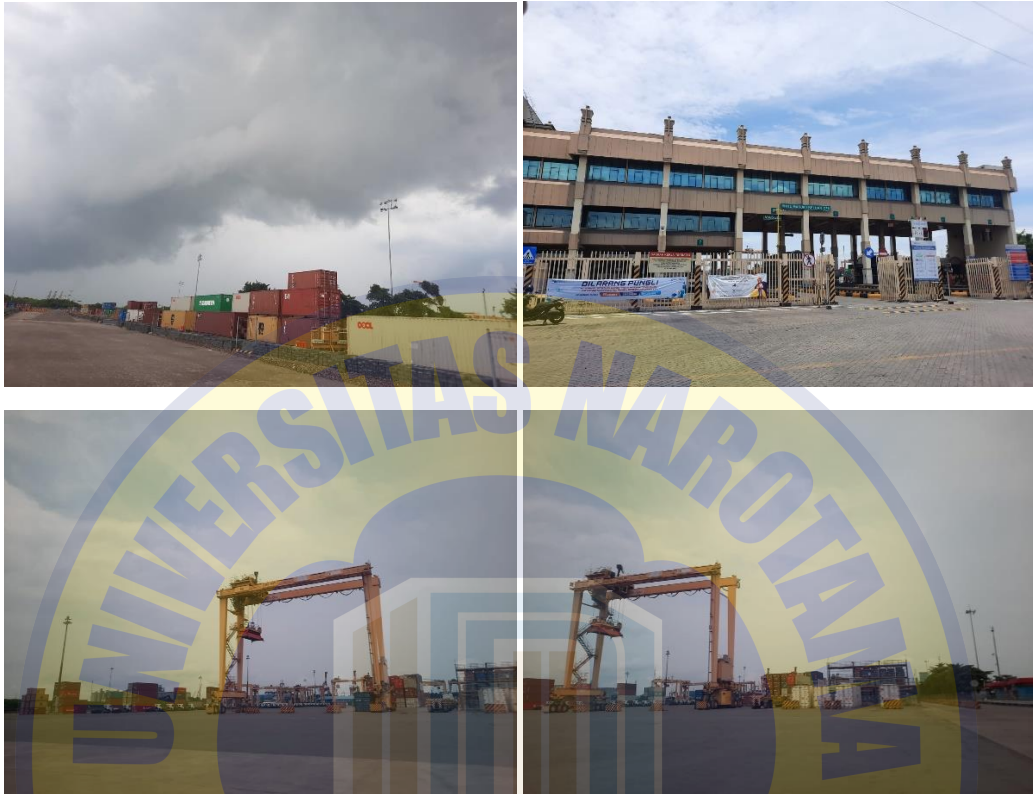
Foto dermaga Peti Kemas Pelabuhan Tanjung Perak Surabaya