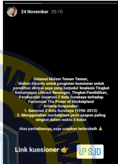
Gambar Lampiran 5.1 Share Link Kuesioner by Instagram