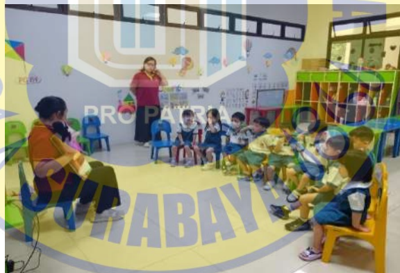
Gambar 4. 4 Foto Siklus II Pertemuan 2

Pertemuan kedua, penyampaian cerita ini ada beberapa kosakata yang ditekan dalam pengucapan dan intonasinya, antara lain kosakata shù 树 (pohon besar)、 shuǐ 水 (air)、 shān 山 (gunung). Siklus kedua, Guru memberikan penguatan positif berupa pujian setiap kali anak mencoba mengucapkan kosakata dengan benar. Berikut ini adalah foto gambar bercerita guru dengan media boneka tangan dan buku bercerita.