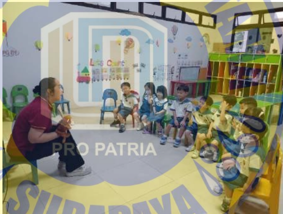
Gambar 4. 3 Foto Siklus II Pertemuan I

Guru memulai bercerita dengan pendahuluan memulai dengan menggunakan boneka tangan monyet. Dengan boneka tangan ingin menyampaikan pada siswa hal-hal saat memperhatikan guru, antara mendengarkan cerita dengan seksama. Adapun tujuan menggunakan boneka tangan untuk menarik perhatian anak saat mendengarkan cerita.