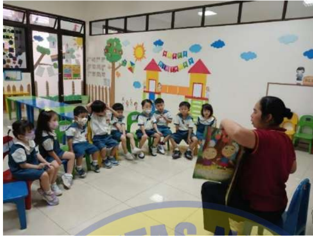
Gambar 4. 2 Cerita pada siklus 1 pertemuan kedua