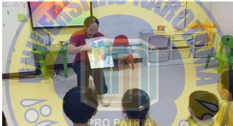
Gambar 4. 1 Cerita Siklus 1 pertemuan pertama

Kemudian guru mulai bercerita dengan diawali membacakan judul dari buku tersebut. Kemudian menyampaikan cerita dengan gaya, ekspresi dan mimik dengan penekanan target penguasaan kosakata yang diajarkan pada siswa. Untuk target penguasaan kosakata, guru mengulang beberapa kali. Setelah guru, meminta siswa agar ikut mengucapkan kosakata yang diminta.