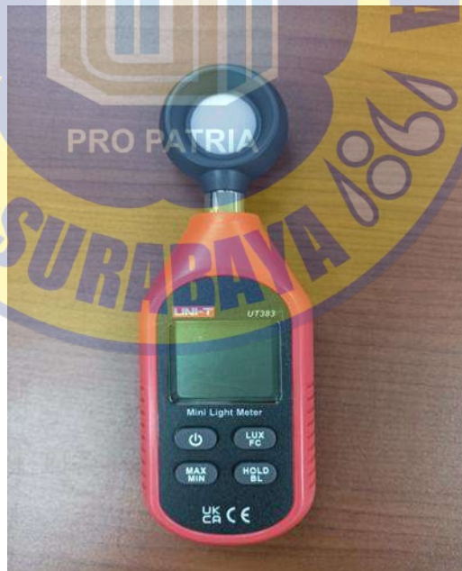
Gambar 3.2. Lux Meter

Dalam penelitian ini digunakan lux meter untuk mengukur instensitas cahaya dan energi meter untuk mengukur energi listrik yang dikonsumsi.