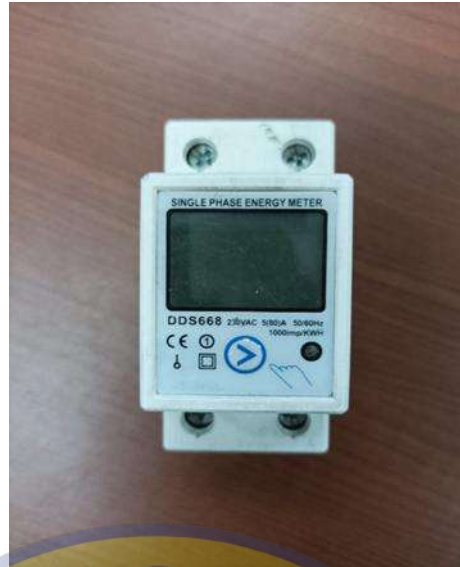
Gambar 3.3. Energi Meter