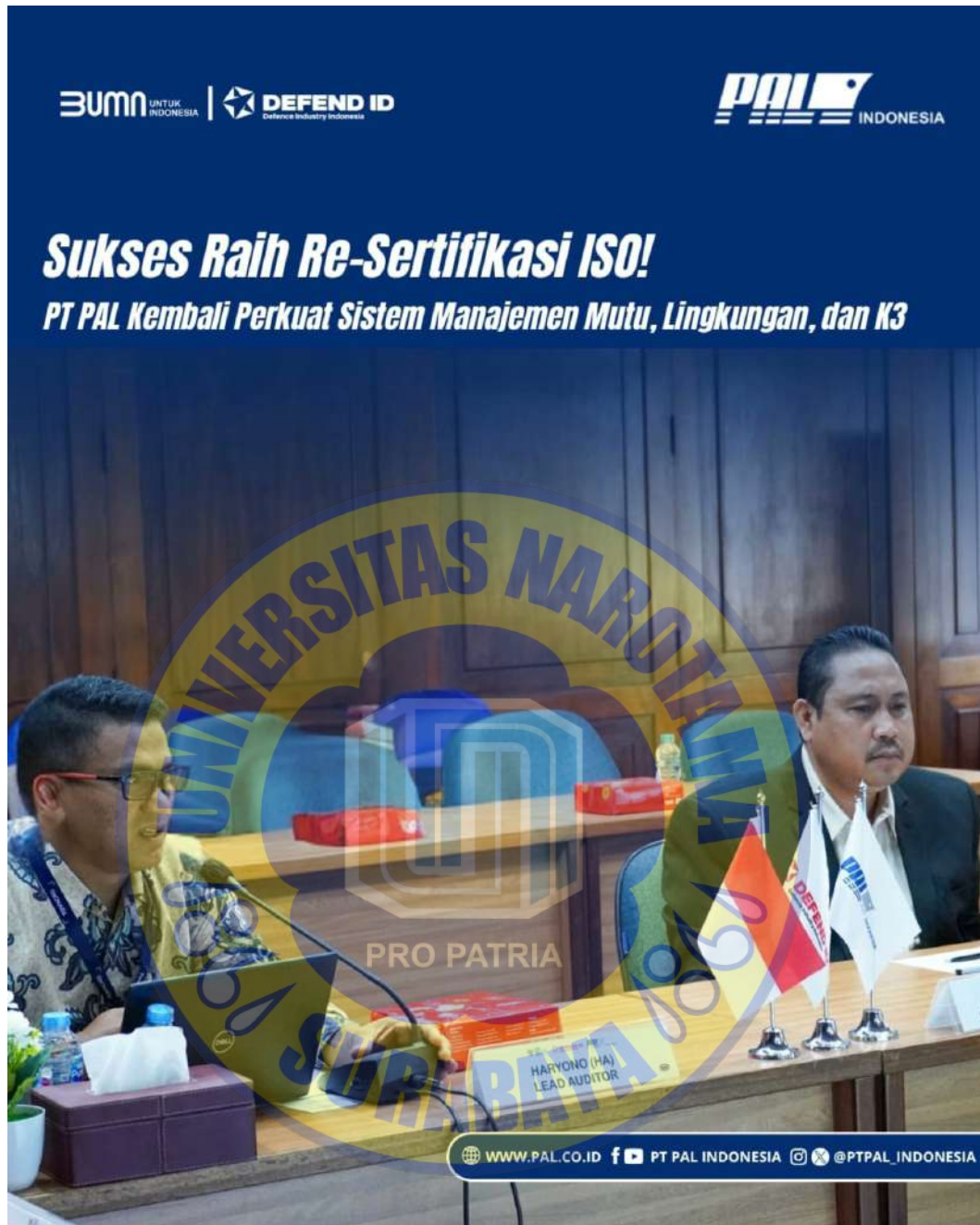
Gambar 2.5. Audit Re-Sertifikasi ISO 14001:2015 (Sistem Manajemen Lingkungan) di PT PAL

Bagi Indonesia, titik temu antara peluang ekonomi hijau dan desakan mitigasi iklim terletak pada PT PAL Indonesia, galangan BUMN strategis yang menopang armada pertahanan sekaligus proyek komersial. Posisi ini selaras dengan