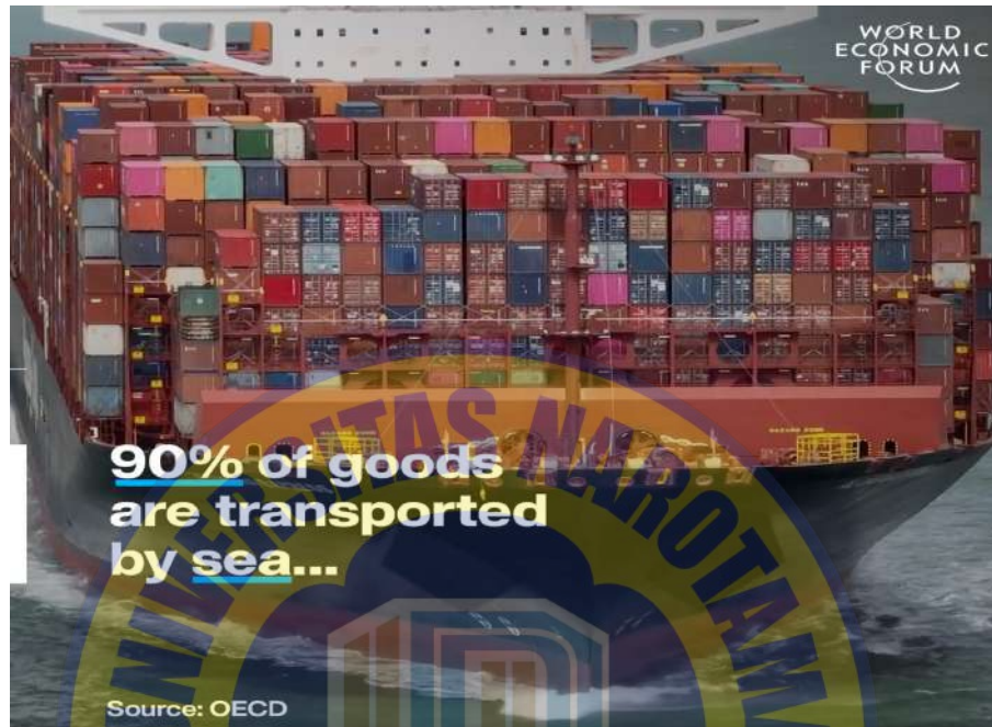
Gambar 2.7. Peran Vital Perkapalan dalam Industri Global

Sektor perkapalan merupakan bagian penting dari perdagangan global, mengangkut sekitar 90% dari total volume perdagangan dunia (OECD, 2021). Namun di balik perannya yang vital, industri ini juga menyumbang dampak lingkungan yang signifikan. Menurut laporan dari International Maritime Organization (IMO, 2020), sektor perkapalan bertanggung jawab atas sekitar 2–3% dari total emisi gas rumah kaca (GRK) global, terutama dalam bentuk karbon dioksida (CO 2 ), metana (CH 4 ), dan nitrogen oksida (NO x ) yang dihasilkan dari pembakaran bahan bakar fosil. Emisi ini tidak hanya memperburuk pemanasan global, tetapi juga berkontribusi pada pencemaran udara yang berdampak buruk terhadap kesehatan masyarakat pesisir.