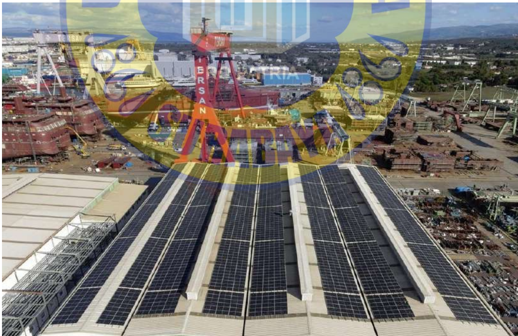
Gambar 2.2. Penerapan Green Shipyard melalui Solar Panel pada Tersan Shipyard

Sementara itu, pengelolaan limbah juga menjadi bagian integral dari strategi ini. Dalam praktik green shipyard , limbah logam, pelumas, dan bahan kimia tidak hanya ditangani secara reaktif, tetapi dikelola secara sirkular. Misalnya, limbah baja dari proses pemotongan diolah kembali menjadi komponen sekunder, sementara pelumas bekas diolah menggunakan sistem filtrasi berlapis untuk digunakan ulang. Menurut Vakili et al. (2022), galangan yang menerapkan kerangka Fuzzy Multi-Attribute Group Decision Making (F-MAGDM) dalam pengambilan keputusan investasi lingkungan mampu mengintegrasikan pertimbangan lingkungan, teknis, dan finansial secara bersamaan, dan menghasilkan efisiensi energi sebesar 17% serta penurunan limbah berbahaya sebesar 23% dalam satu tahun operasional.