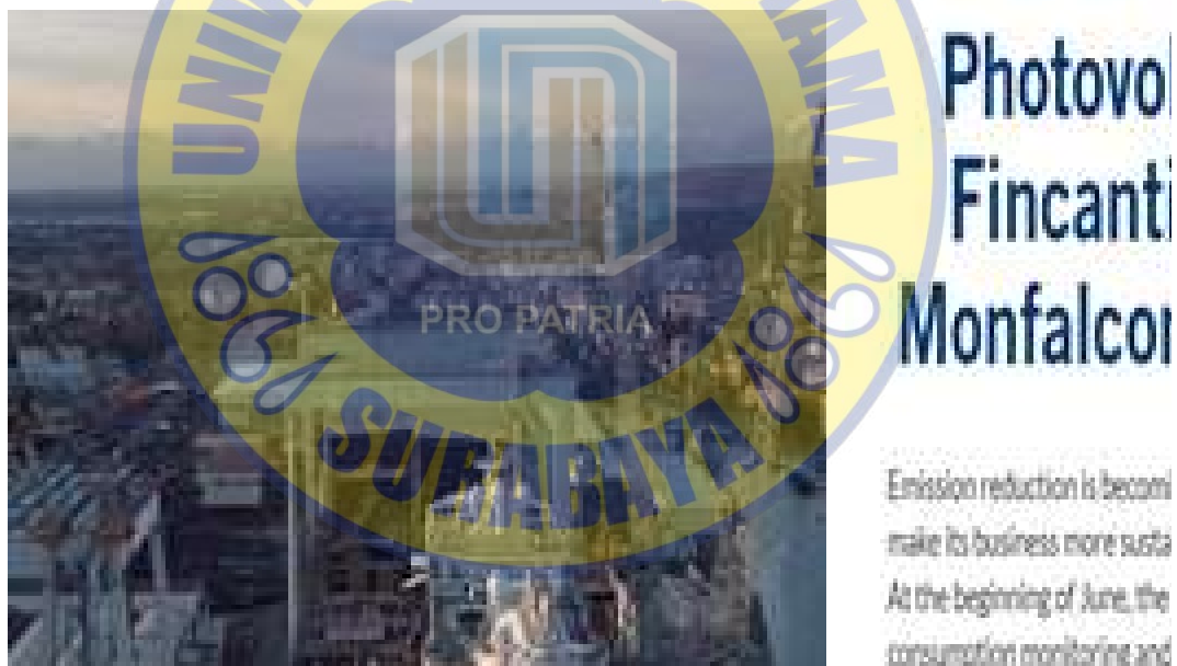
Gambar 2.3. Penerapan Green Shipyard pada Fincantieri Shipyard

Dalam konteks Asia, galangan-galangan besar seperti Tersan Shipyard (Turki) dan Fincantieri (Italia) telah menjadi pionir dalam pengimplementasian strategi hijau melalui integrasi panel surya dan energi angin bersertifikasi. Tersan kini menggunakan 100% pasokan listrik berbasis I-REC (Renewable Energy Certificates), sedangkan Fincantieri memanfaatkan lebih dari 22.000 panel surya untuk mendukung operasi di lima fasilitas galangannya, yang mampu menghasilkan listrik bersih sekitar 11 GWh per tahun. Praktik ini tidak hanya memperlihatkan tanggung jawab lingkungan, tetapi juga memperkuat reputasi perusahaan di mata pasar internasional, terutama di Eropa yang mulai menerapkan kebijakan Carbon Border Adjustment Mechanism (CBAM) .