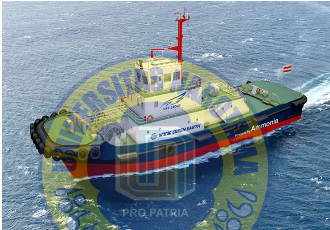
Gambar 2.4. Penerapan Green Product pada Tugboat SAKIGAKE

konvensional. Inovasi ini menjadi peluang besar bagi galangan kapal yang ingin mengadopsi atau membangun kapal dengan sistem bahan bakar alternatif berbasis amonia, hidrogen, atau biofuel, karena pasar global kini makin terbuka terhadap produk kapal rendah emisi.