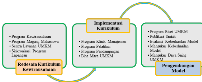
Gambar 2: Peran Perguruan Tinggi Dalam Pengembangan Pengelolaan UMKM

Dalam rekonstruksi model menunjukkan bahwa untuk membangun daya saing UMKM diperlukan tiga tahapan dimana tahapan satu dengan tahapan berikutnya merupakan bagian yang tidak terpisah, oleh karena itu program harus dirancang secara ter-integrated agar optimalisasi peran perguruan tinggi benar benar memberi kontribusi riil dalam memperkuat daya saing UMKM. Implementasi kurikulum merupakan tahapan yang sangat krusial karena pada tahap ini memerlukan sumber daya lembaga perguruan tinggi yang sangat besar, baik untuk biaya operasional, biaya tenaga kerja, prasarana penunjang, monitoring dan evaluasi kegiatan sentra layanan manajemen kepada pelaku UMKM. Demikian juga pengembangan model meliputi aspek yang tidak mudah karena menyangkut kompetensi peneliti serta sumber pendanaan untuk operasionalnya.