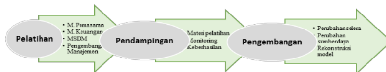
Gambar 1: Rekonstruksi Model Pengelolaan Sentra UMKM