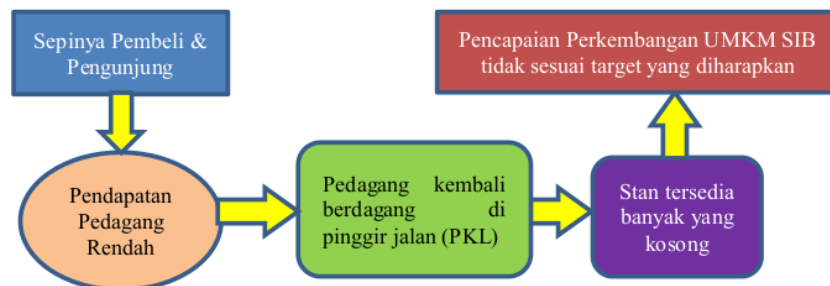
Gambar 1. Skema Penentuan Faktor Utama Penghambat Perkembangan SIB Kenjeran

Berdasarkan data yang diperoleh dari studi literatur (Sakti & Wachidin, 2018) dan studi lapangan melalui wawancara dengan koordinator SIB Kenjeran, beberapa pedagang yang berjualan di SIB dan yang berjualan dipinggir jalan (PKL) serta melalui hasil survey dan observasi di Sentra Ikan Bulak di lantai 1, maka dapat ditentukan Faktor Penyebab Utama terhambatnya perkembangan UMKM SIB Kenjeran. Melalui Skema pada gambar 1, dapat diamati alur proses faktor utama tersebut berdampak pada tumbuh kembangnya UMKM SIB Kenjeran.