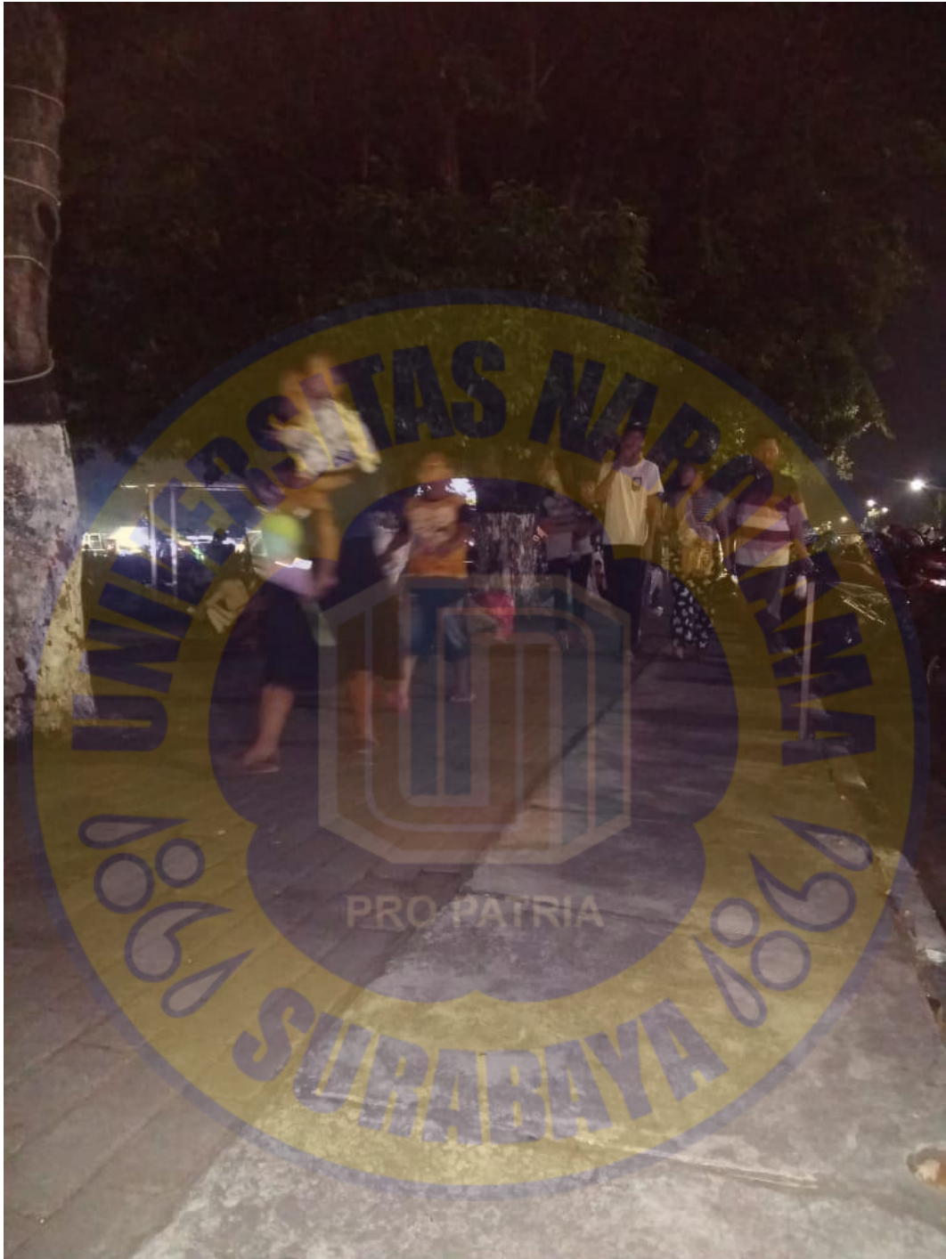
Sumber : Lokasi penelitian jalan Raden Wijaya