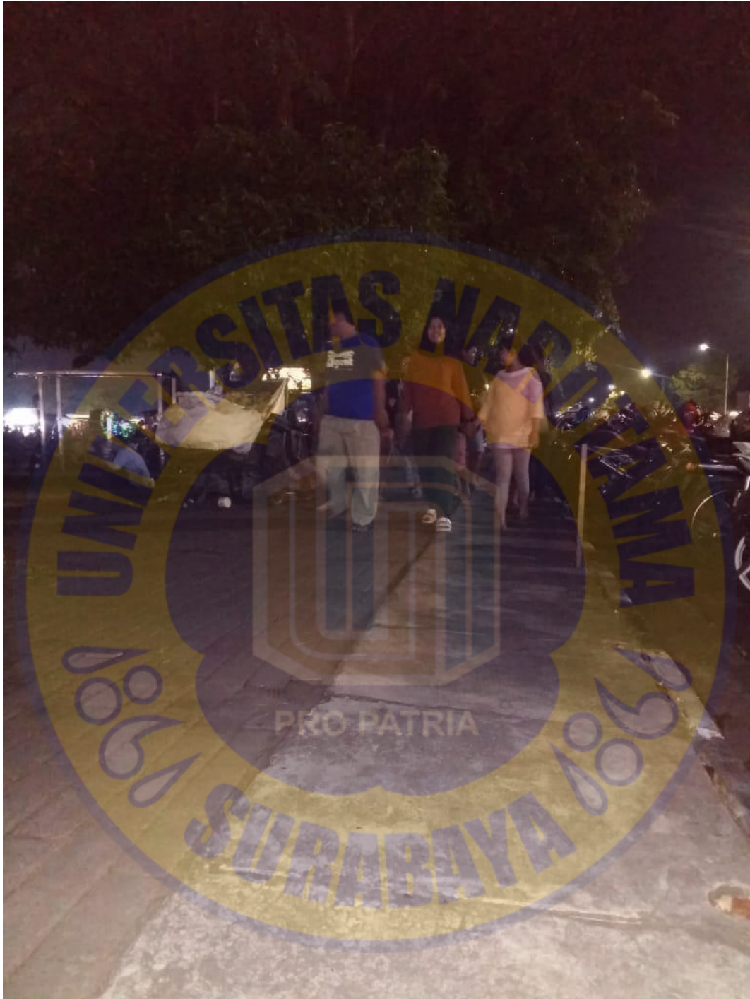
Sumber : Lokasi penelitian jalan Raden Wijaya